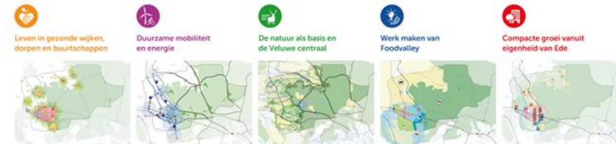
Figuur 1 Strategische keuzes omgevingsvisie

In 2022 heeft de gemeenteraad de Omgevingsvisie Ede 2040 vastgesteld met daarin de koers voor het gehele Ruimtelijk Domein voor de komende 20 jaar. Hierin zijn de vijf strategische keuzes voor de gemeente Ede opgenomen.