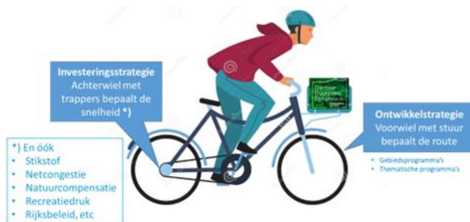
Figuur 2 de fiets O&I

De trappers en het achterwiel staan voor de snelheid van uitvoering/ontwikkeling die wordt bepaald in de Investeringsstrategie. Hierin worden de financiële middelen en de beschikbare capaciteit in de tijd gezet voor de verschillende ontwikkelgebieden.